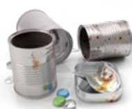
Förpackningar ska sorteras fastighetsnära. Sid 7