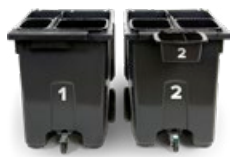
Nya avfallskärl för enklare sortering hemma. Sid: 4

Håll ögonen öppna efter nästa broschyr som kommer skickas ut under våren med detaljerad information om de nya avfallskärlen. Leverans av kärlen startar i oktober. För mer information redan idag, besök hemsortering.nu .