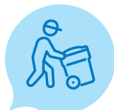
Nya abonnemang och hämtningsintervall. Sid 3