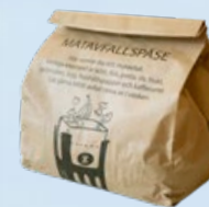
Matavfall i försluten påse

Lämnas till en återvinningsstation (ÅVS) eller på återvinningscentral (ÅVC).