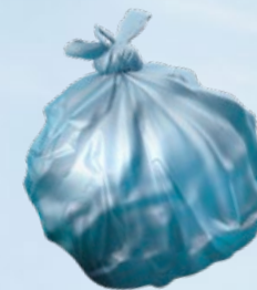
Restavfall i försluten påse