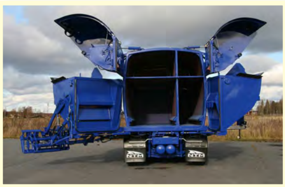
Så här ser vår fyrfacksbil ut.

*Kärlen töms under april-september (vecka 14-39). Tömning vintertid kan beställas som extratjänst och sker då vid nästkommande ordinarie tömningsrunda för helårsboende.